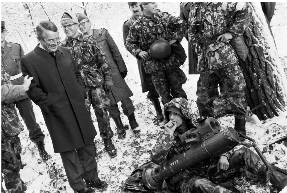
Lustig ist das Soldatenleben: Arnold Koller informiert sich im November 1988 über ein Panzerabwehr-Lenkwaffensystem.

In der Vergangenheit hat sich die Gelegenheit zur Flucht oft nach etwa drei Jahren geboten. So lange musste sich Jean-Pascal Delamuraz (FDP) gedulden, bis 1987 das Wirtschaftsdepartement frei wurde und er das Militär endlich abgeben konnte. Ebenso Guy Parmelin (SVP), den es 30 Jahre später ebenfalls zur (Land-)Wirtschaft zog. Dazwischen wechselte Arnold Koller (CVP) nach den ominösen drei Jahren 1989 vom Militärdepartement zu Justiz und Polizei. Mehr als doppelt so lang hielten es Kaspar Villiger (FDP, 1989–1995) und Ueli Maurer (SVP, 2009–2016) aus, bis sie ins Finanzdepartement umsiedelten – Villiger nach einer gewonnenen Kampfjet-Abstimmung über die F/A-18, Maurer nach einer verlorenen über den Gripen.