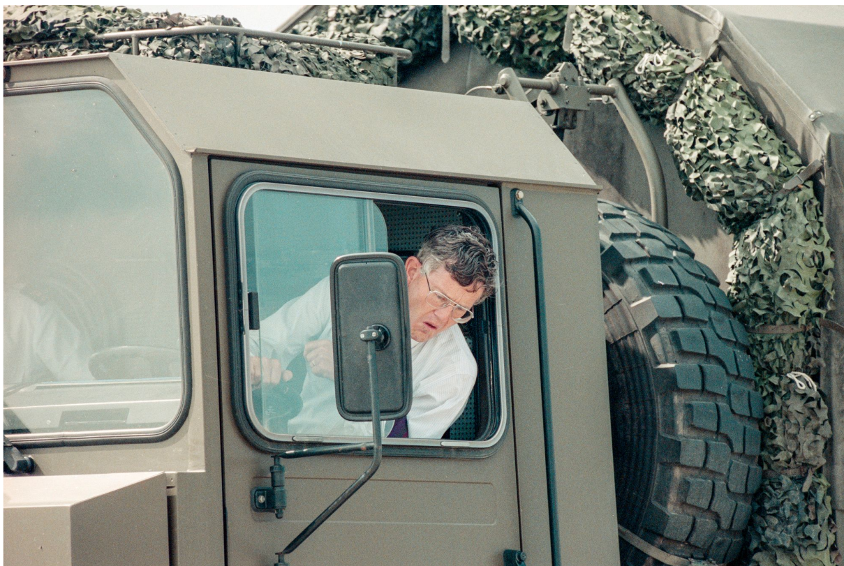
Der Chef fährt selbst: Kaspar Villiger im August 1989 auf einem Geschicklichkeitsparcours.