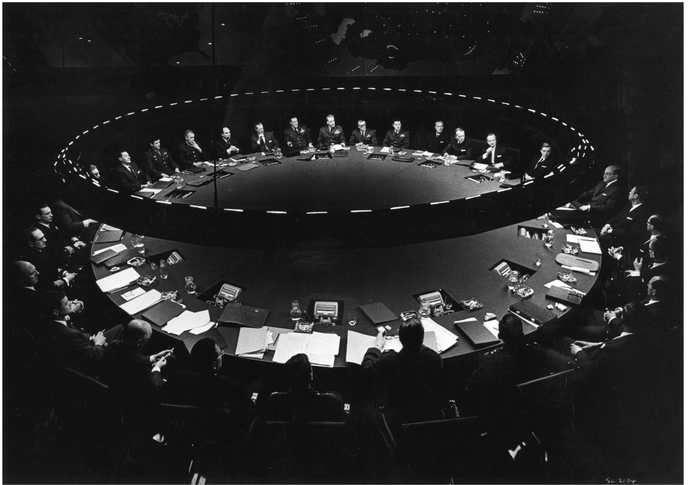
Der Corona-Krisenstab in Bern? Die Männerquote passt auf jeden Fall. Szene aus dem Kubrick-Film «Dr. Strangelove or: How I Learned to Stop Worrying and Love the Bomb» (1964).