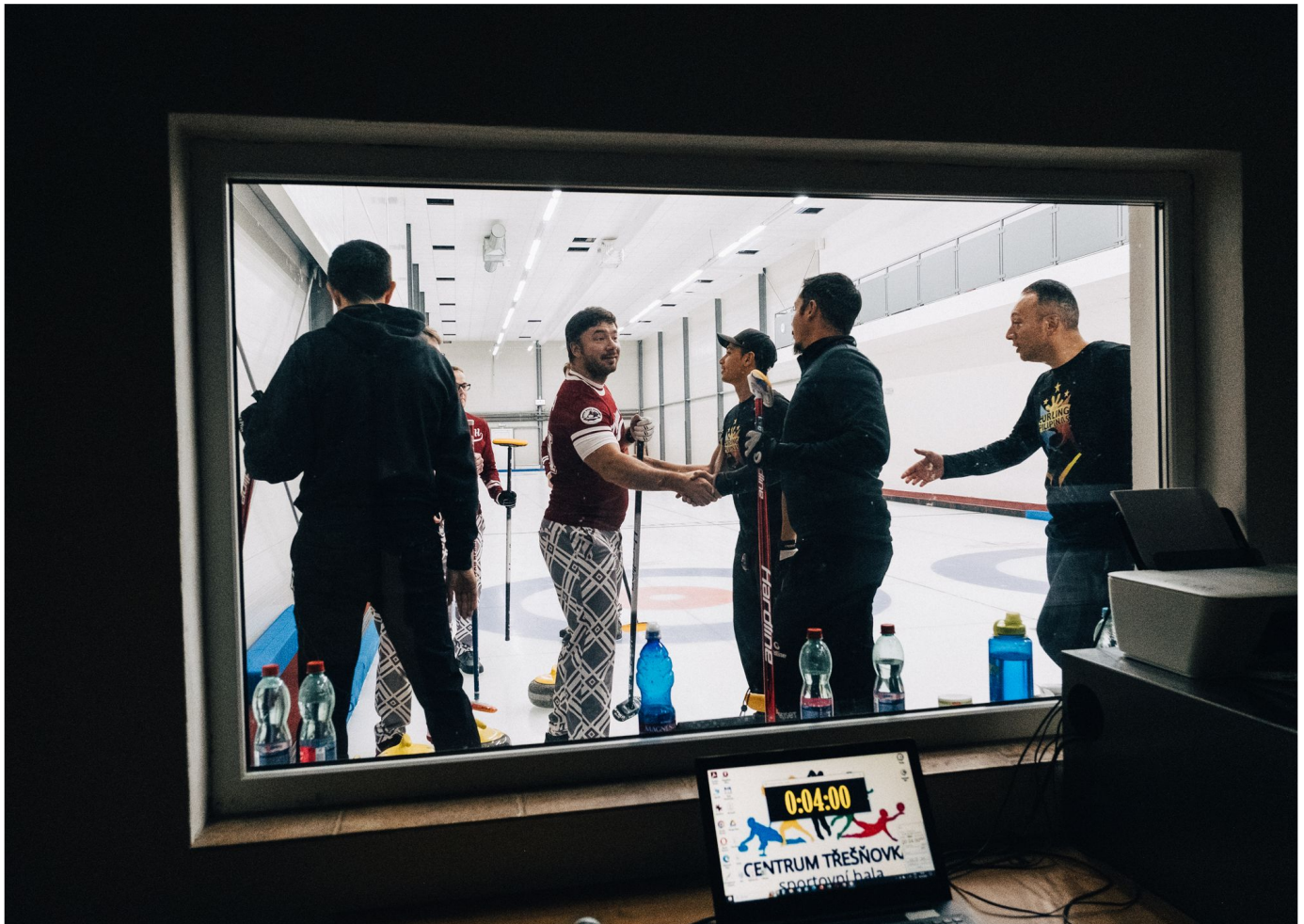
Das philippinische Team (in Schwarz) nimmt die Glückwünsche nach dem Sieg gegen das zweite tschechische Team entgegen.