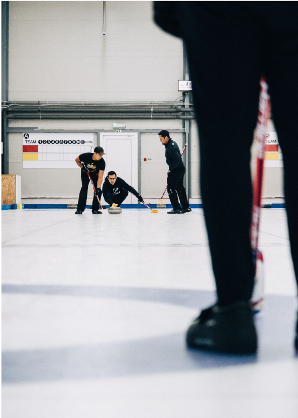
Einer legt den Stein ...

Überhört man das Geschrei, ist ein Curling-Turnier ein Grundrauschen, das entsteht, weil ständig ein Stein über das Eis schleift. Dazwischen helles Klacken, wenn Steine aufeinandertreffen. Das ist der Soundtrack von Hallers Leben.