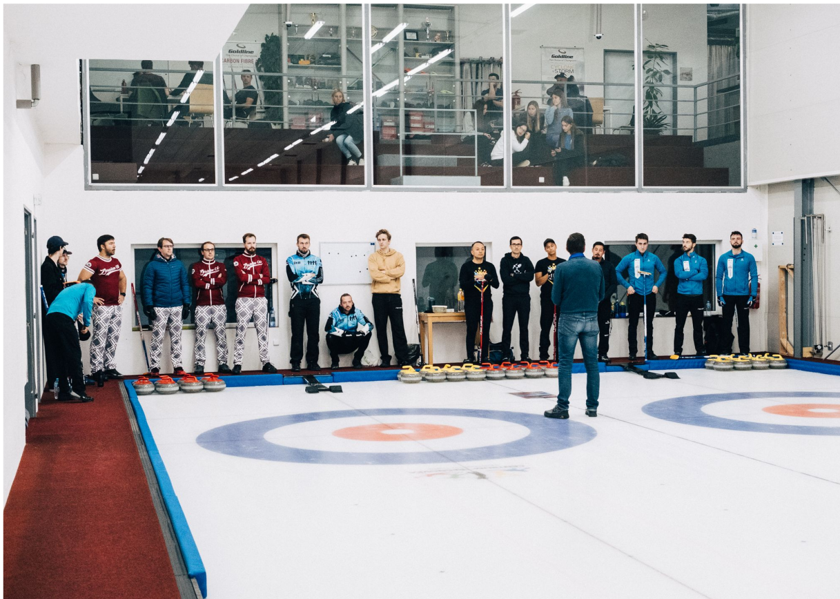
Vor dem ersten Spiel, gegen Italien (ganz rechts) – darüber die italienischen Fans, die noch zuversichtlich sind.

Ihre Erfahrung besagt, dass Erfolg an beiden Orten entsteht.