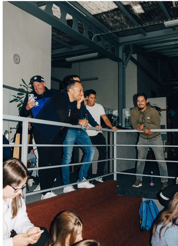
... dass am Ende die Freude über den zweiten Turnierrang blieb.

Profiteams dokumentieren Züge, werten Erfolgsquoten aus, berechnen Wahrscheinlichkeiten. Doch jedes Spiel ist anders als das vorherige. Nie ist zwingend, dass der Bessere gewinnt. Es gewinnt, wer fähig ist, im entscheidenden Moment zu punkten. Das spricht für die philippinische Nationalmannschaft. Die Wahrscheinlichkeit haben sie nicht auf ihrer Seite, aber ob sie sich qualifizieren, hängt von vielen anderen Fragen ab. Haben sie das Glück dazu? Behalten sie die Nerven, wenn es drauf ankommt?