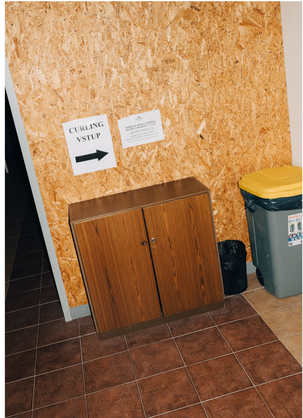
... und das ist keine der Wände, gegen die er zahlreiche seiner beruflichen Projekte gefahren hat.

Im Jahr 2014 hatte Frei diese eine andere Idee: Sextoys über das Internet verkaufen.