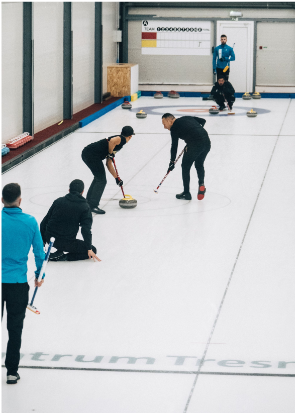
Ein Stein um den anderen setzte das Team so gut, ...

Auch das gehört zum Curling. Die Unberechenbarkeit.