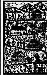
Signet des Museums Ballenberg.

«Lasst die Schweiz nicht zu einem grossen Ballenberg werden», an diese zuweilen gehörte Bemerkung knüpfte die Berner Ständerrätin Christine Beerli (fdp.) am Donnerstag in Brienz ihre Laudatio auf den diesjährigen Träger des mit 50 000 Franken dotierten Oertli-Preises, eben das Freilichtmuseum Ballenberg, an. Was im geschlossenen Raum des Museums richtig ist, könne für die offene Gesellschaft, in der wir leben, schädlich sein. Andererseits benötigten wir, bei aller Anpassungsfähigkeit und Flexibilität, Kenntnisse der Geschichte und Verankerung in der Tradition: «Nur wer feste und tiefe Wurzeln hat, kann sich im Wind bewegen und so den Sturm ohne Schaden überstehen.» In diesem Sinne brauche auch eine moderne Schweiz das museale Ballenberg als einen Lehrpfad in die Vergangenheit, der zu echtem Selbstbewusstsein führen und so den Weg in die Zukunft aufzeigen könne.